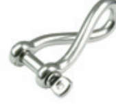
Zincir Kiledi ( Burgulu tip )