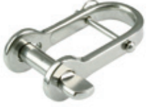
Zincir Kiledi ( Gözlü D Tipi )