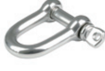
Zincir Kiledi ( D Tipi )