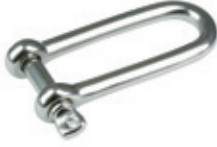
Zincir Kiledi ( Uzun D Tipi )