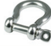
Zincir Kiledi ( Omega Tipi )