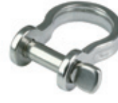
Zincir Kiledi ( Düz Omega Tipi )