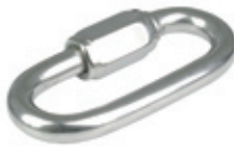
Karabına ( Vidalı Kilit )