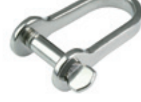
Zincir Kiledi ( Uzun Düz D Tipi )