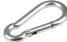
Karabına ( Yana Açılır )