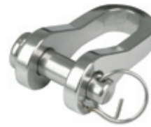
Zincir Kiledi ( Uzun Düz D Tipi )