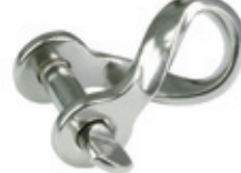
Zincir Kiledi ( Düz Burgulu tip )