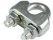
Klemens ( Kerye )